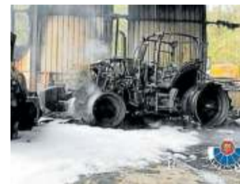
Uno de los vehículos afectados.